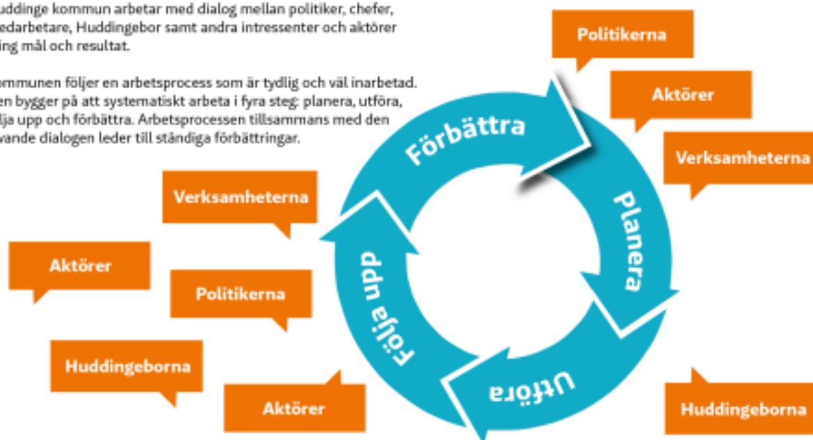
Förbättringshjulet och planerings- och uppföljningsprocessen

Kommunen följer en arbetsprocess som är tydlig och väl inarbetad. Den bygger på att systematiskt arbeta i fyra steg: planera, utföra, följa upp och förbättra. Arbetsprocessen tillsammans med den levande dialogen leder till ständiga förbättringar.